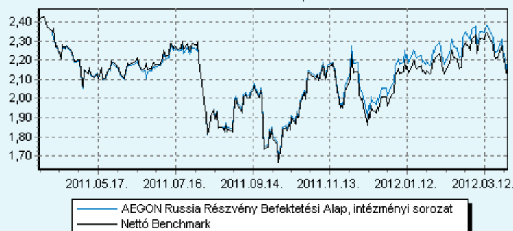
EGY JEGYRE JUTÓ NETTÓ ESZKÖZÉRTÉK, 2011.04.01 - 2012.03.31

Az alapok múltbeli teljesítménye nem nyújt garanciát a jövőbeli hozamok nagyságára. Jelen hirdetés nem minősül ajánlattételnek vagy befektetési tanácsadásnak. A befektetés részletes feltételeit az Alap Tájékoztatója tartalmazza, mely a mindenkor érvényes kondíciós listákkal együtt megtalálható a forgalmazási helyeken. A befektetési alap forgalmazásával (vétel, tartás, eladás) kapcsolatos költségek az alap kezelési szabályzatában és a forgalmazási helyeken megismerhetők.