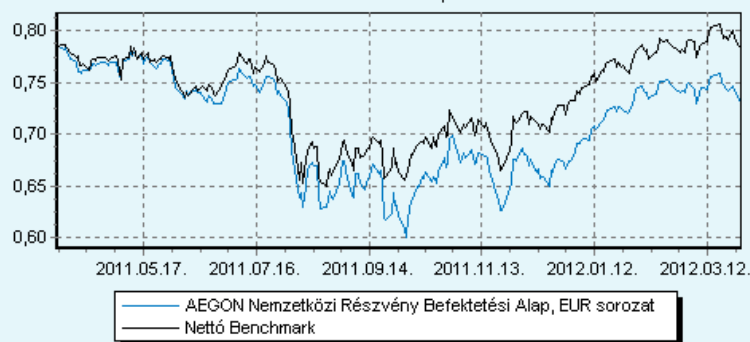
EGY JEGYRE JUTÓ NETTÓ ESZKÖZÉRTÉK, 2011.04.01 - 2012.03.31

Az alapok múltbeli teljesítménye nem nyújt garanciát a jövőbeli hozamok nagyságára. Jelen hirdetés nem minősül ajánlattételnek vagy befektetési tanácsadásnak. A befektetés részletes feltételeit az Alap Tájékoztatója tartalmazza, mely a mindenkor érvényes kondíciós listákkal együtt megtalálható a forgalmazási helyeken. A befektetési alap forgalmazásával (vétel, tartás, eladás) kapcsolatos költségek az alap kezelési szabályzatában és a forgalmazási helyeken megismerhetők.