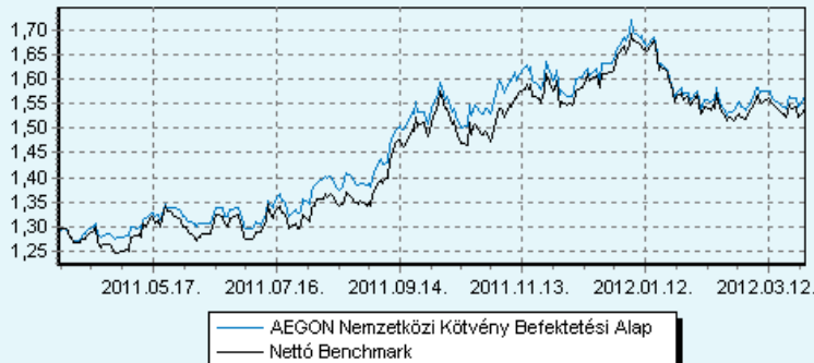
EGY JEGYRE JUTÓ NETTÓ ESZKÖZÉRTÉK, 2011.04.01 - 2012.03.31

Az alapok múltbeli teljesítménye nem nyújt garanciát a jövőbeli hozamok nagyságára. Jelen hirdetés nem minősül ajánlattételnek vagy befektetési tanácsadásnak. A befektetés részletes feltételeit az Alap Tájékoztatója tartalmazza, mely a mindenkor érvényes kondíciós listákkal együtt megtalálható a forgalmazási helyeken. A befektetési alap forgalmazásával (vétel, tartás, eladás) kapcsolatos költségek az alap kezelési szabályzatában és a forgalmazási helyeken megismerhetők.