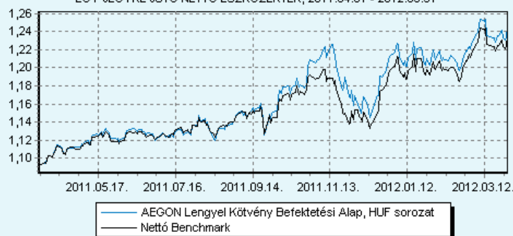
EGY JEGYRE JUTÓ NETTÓ ESZKÖZÉRTÉK, 2011.04.01 - 2012.03.31

Az alapok múltbeli teljesítménye nem nyújt garanciát a jövőbeli hozamok nagyságára. Jelen hirdetés nem minősül ajánlattételnek vagy befektetési tanácsadásnak. A befektetés részletes feltételeit az Alap Tájékoztatója tartalmazza, mely a mindenkor érvényes kondíciós listákkal együtt megtalálható a forgalmazási helyeken. A befektetési alap forgalmazásával (vétel, tartás, eladás) kapcsolatos költségek az alap kezelési szabályzatában és a forgalmazási helyeken megismerhetők.