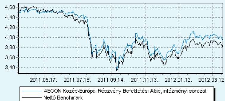
EGY JEGYRE JUTÓ NETTÓ ESZKÖZÉRTÉK, 2011.04.01 - 2012.03.31

Az alapok múltbeli teljesítménye nem nyújt garanciát a jövőbeli hozamok nagyságára. Jelen hirdetés nem minősül ajánlattételnek vagy befektetési tanácsadásnak. A befektetés részletes feltételeit az Alap Tájékoztatója tartalmazza, mely a mindenkor érvényes kondíciós listákkal együtt megtalálható a forgalmazási helyeken. A befektetési alap forgalmazásával (vétel, tartás, eladás) kapcsolatos költségek az alap kezelési szabályzatában és a forgalmazási helyeken megismerhetők.