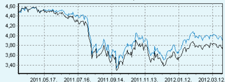
EGY JEGYRE JUTÓ NETTÓ ESZKÖZÉRTÉK, 2011.04.01 - 2012.03.31

Az alapok múltbeli teljesítménye nem nyújt garanciát a jövőbeli hozamok nagyságára. Jelen hirdetés nem minősül ajánlattételnek vagy befektetési tanácsadásnak. A befektetés részletes feltételeit az Alap Tájékoztatója tartalmazza, mely a mindenkor érvényes kondíciós listákkal együtt megtalálható a forgalmazási helyeken. A befektetési alap forgalmazásával (vétel, tartás, eladás) kapcsolatos költségek az alap kezelési szabályzatában és a forgalmazási helyeken megismerhetők.