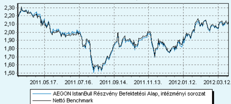
EGY JEGYRE JUTÓ NETTÓ ESZKÖZÉRTÉK, 2011.04.01 - 2012.03.31

Az alapok múltbeli teljesítménye nem nyújt garanciát a jövőbeli hozamok nagyságára. Jelen hirdetés nem minősül ajánlattételnek vagy befektetési tanácsadásnak. A befektetés részletes feltételeit az Alap Tájékoztatója tartalmazza, mely a mindenkor érvényes kondíciós listákkal együtt megtalálható a forgalmazási helyeken. A befektetési alap forgalmazásával (vétel, tartás, eladás) kapcsolatos költségek az alap kezelési szabályzatában és a forgalmazási helyeken megismerhetők.