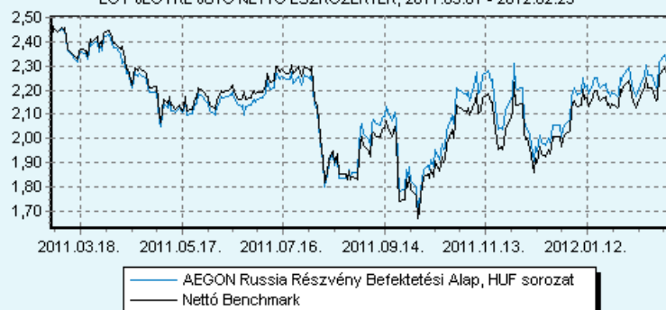
EGY JEGYRE JUTÓ NETTÓ ESZKÖZÉRTÉK, 2011.03.01 - 2012.02.29

Az alapok múltbeli teljesítménye nem nyújt garanciát a jövőbeli hozamok nagyságára. Jelen hirdetés nem minősül ajánlattételnek vagy befektetési tanácsadásnak. A befektetés részletes feltételeit az Alap Tájékoztatója tartalmazza, mely a mindenkor érvényes kondíciós listákkal együtt megtalálható a forgalmazási helyeken. A befektetési alap forgalmazásával (vétel, tartás, eladás) kapcsolatos költségek az alap kezelési szabályzatában és a forgalmazási helyeken megismerhetők.