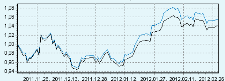
EGY JEGYRE JUTÓ NETTÓ ESZKÖZÉRTÉK, 2011.03.01 - 2012.02.29

— AEGON Lengyel Részvény Befektetési Alap, intézményi sorozat — Nettó Benchmark