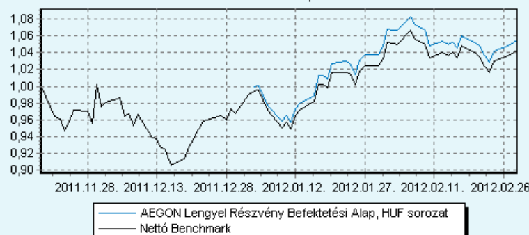
EGY JEGYRE JUTÓ NETTÓ ESZKÖZÉRTÉK, 2011.03.01 - 2012.02.29

Az alapok múltbeli teljesítménye nem nyújt garanciát a jövőbeli hozamok nagyságára. Jelen hirdetés nem minősül ajánlattételnek vagy befektetési tanácsadásnak. A befektetés részletes feltételeit az Alap Tájékoztatója tartalmazza, mely a mindenkor érvényes kondíciós listákkal együtt megtalálható a forgalmazási helyeken. A befektetési alap forgalmazásával (vétel, tartás, eladás) kapcsolatos költségek az alap kezelési szabályzatában és a forgalmazási helyeken megismerhetők.