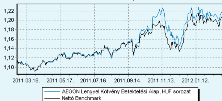
EGY JEGYRE JUTÓ NETTÓ ESZKÖZÉRTÉK, 2011.03.01 - 2012.02.29

Az alapok múltbeli teljesítménye nem nyújt garanciát a jövőbeli hozamok nagyságára. Jelen hirdetés nem minősül ajánlattételnek vagy befektetési tanácsadásnak. A befektetés részletes feltételeit az Alap Tájékoztatója tartalmazza, mely a mindenkor érvényes kondíciós listákkal együtt megtalálható a forgalmazási helyeken. A befektetési alap forgalmazásával (vétel, tartás, eladás) kapcsolatos költségek az alap kezelési szabályzatában és a forgalmazási helyeken megismerhetők.