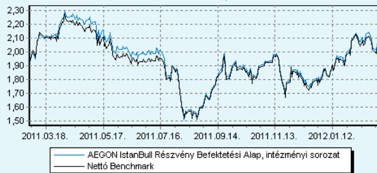
EGY JEGYRE JUTÓ NETTÓ ESZKÖZÉRTÉK, 2011.03.01 - 2012.02.29

Az alapok múltbeli teljesítménye nem nyújt garanciát a jövőbeli hozamok nagyságára. Jelen hirdetés nem minősül ajánlattételnek vagy befektetési tanácsadásnak. A befektetés részletes feltételeit az Alap Tájékoztatója tartalmazza, mely a mindenkor érvényes kondíciós listákkal együtt megtalálható a forgalmazási helyeken. A befektetési alap forgalmazásával (vétel, tartás, eladás) kapcsolatos költségek az alap kezelési szabályzatában és a forgalmazási helyeken megismerhetők.