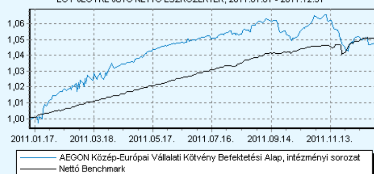
EGY JEGYRE JUTÓ NETTÓ ESZKÖZÉRTÉK, 2011.01.01 - 2011.12.31

Az alapok múltbeli teljesítménye nem nyújt garanciát a jövőbeli hozamok nagyságára. Jelen hirdetés nem minősül ajánlattételnek vagy befektetési tanácsadásnak. A befektetés részletes feltételeit az Alap Tájékoztatója tartalmazza, mely a mindenkor érvényes kondíciós listákkal együtt megtalálható a forgalmazási helyeken. A befektetési alap forgalmazásával (vétel, tartás, eladás) kapcsolatos költségek az alap kezelési szabályzatában és a forgalmazási helyeken megismerhetők.