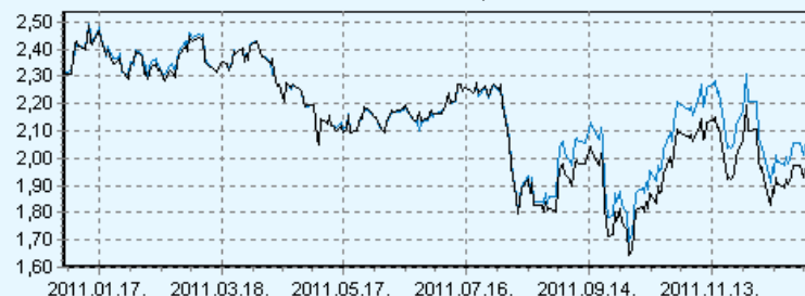
EGY JEGYRE JUTÓ NETTÓ ESZKÖZÉRTÉK, 2011.01.01 - 2011.12.31

Az alapok múltbeli teljesítménye nem nyújt garanciát a jövőbeli hozamok nagyságára. Jelen hirdetés nem minősül ajánlattételnek vagy befektetési tanácsadásnak. A befektetés részletes feltételeit az Alap Tájékoztatója tartalmazza, mely a mindenkor érvényes kondíciós listákkal együtt megtalálható a forgalmazási helyeken. A befektetési alap forgalmazásával (vétel, tartás, eladás) kapcsolatos költségek az alap kezelési szabályzatában és a forgalmazási helyeken megismerhetők.