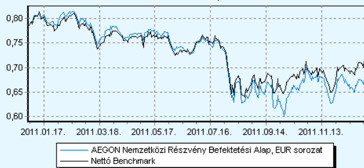
EGY JEGYRE JUTÓ NETTÓ ESZKÖZÉRTÉK, 2011.01.01 - 2011.12.31

Az alapok múltbeli teljesítménye nem nyújt garanciát a jövőbeli hozamok nagyságára. Jelen hirdetés nem minősül ajánlattételnek vagy befektetési tanácsadásnak. A befektetés részletes feltételeit az Alap Tájékoztatója tartalmazza, mely a mindenkor érvényes kondíciós listákkal együtt megtalálható a forgalmazási helyeken. A befektetési alap forgalmazásával (vétel, tartás, eladás) kapcsolatos költségek az alap kezelési szabályzatában és a forgalmazási helyeken megismerhetők.