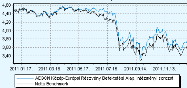
EGY JEGYRE JUTÓ NETTÓ ESZKÖZÉRTÉK, 2011.01.01 - 2011.12.31

Az alapok múltbeli teljesítménye nem nyújt garanciát a jövőbeli hozamok nagyságára. Jelen hirdetés nem minősül ajánlattételnek vagy befektetési tanácsadásnak. A befektetés részletes feltételeit az Alap Tájékoztatója tartalmazza, mely a mindenkor érvényes kondíciós listákkal együtt megtalálható a forgalmazási helyeken. A befektetési alap forgalmazásával (vétel, tartás, eladás) kapcsolatos költségek az alap kezelési szabályzatában és a forgalmazási helyeken megismerhetők.