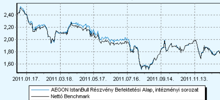
EGY JEGYRE JUTÓ NETTÓ ESZKÖZÉRTÉK, 2011.01.01 - 2011.12.31

Az alapok múltbeli teljesítménye nem nyújt garanciát a jövőbeli hozamok nagyságára. Jelen hirdetés nem minősül ajánlattételnek vagy befektetési tanácsadásnak. A befektetés részletes feltételeit az Alap Tájékoztatója tartalmazza, mely a mindenkor érvényes kondíciós listákkal együtt megtalálható a forgalmazási helyeken. A befektetési alap forgalmazásával (vétel, tartás, eladás) kapcsolatos költségek az alap kezelési szabályzatában és a forgalmazási helyeken megismerhetők.