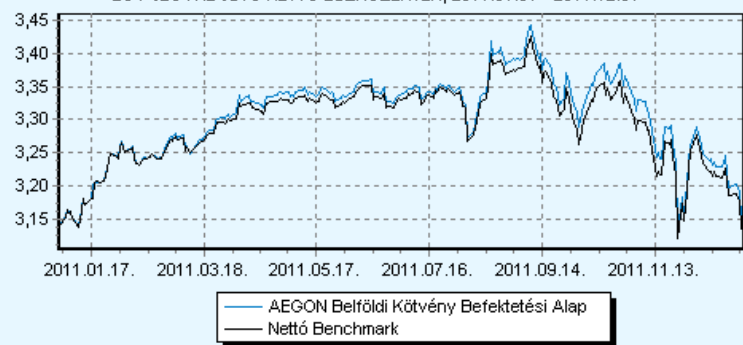
EGY JEGYRE JUTÓ NETTÓ ESZKÖZÉRTÉK, 2011.01.01 - 2011.12.31

Az alapok múltbeli teljesítménye nem nyújt garanciát a jövőbeli hozamok nagyságára. Jelen hirdetés nem minősül ajánlattételnek vagy befektetési tanácsadásnak. A befektetés részletes feltételeit az Alap Tájékoztatója tartalmazza, mely a mindenkor érvényes kondíciós listákkal együtt megtalálható a forgalmazási helyeken. A befektetési alap forgalmazásával (vétel, tartás, eladás) kapcsolatos költségek az alap kezelési szabályzatában és a forgalmazási helyeken megismerhetők.