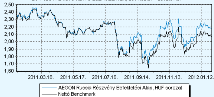
EGY JEGYRE JUTÓ NETTÓ ESZKÖZÉRTÉK, 2011.02.01 - 2012.01.31

Az alapok múltbeli teljesítménye nem nyújt garanciát a jövőbeli hozamok nagyságára. Jelen hirdetés nem minősül ajánlattételnek vagy befektetési tanácsadásnak. A befektetés részletes feltételeit az Alap Tájékoztatója tartalmazza, mely a mindenkor érvényes kondíciós listával együtt megtalálható a forgalmazási helyeken. A befektetési alap forgalmazásával (vétel, tartás, eladás) kapcsolatos költségek az alap kezelési szabályzatában és a forgalmazási helyeken megismerhetők.