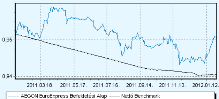
EGY JEGYRE JUTÓ NETTÓ ESZKÖZÉRTÉK, 2011.02.01 - 2012.01.31

Az alapok múltbeli teljesítménye nem nyújt garanciát a jövőbeli hozamok nagyságára. Jelen hirdetés nem minősül ajánlattételnek vagy befektetési tanácsadásnak. A befektetés részletes feltételeit az Alap Tájékoztatója tartalmazza, mely a mindenkor érvényes kondíciós listákkal együtt megtalálható a forgalmazási helyeken. A befektetési alap forgalmazásával (vétel, tartás, eladás) kapcsolatos költségek az alap kezelési szabályzatában és a forgalmazási helyeken megismerhetők.