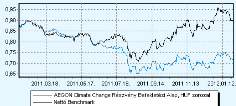
EGY JEGYRE JUTÓ NETTÓ ESZKÖZÉRTÉK, 2011.02.01 - 2012.01.31

Az alapok múltbeli teljesítménye nem nyújt garanciát a jövőbeli hozamok nagyságára. Jelen hirdetés nem minősül ajánlattételnek vagy befektetési tanácsadásnak. A befektetés részletes feltételeit az Alap Tájékoztatója tartalmazza, mely a mindenkor érvényes kondíciós listákkal együtt megtalálható a forgalmazási helyeken. A befektetési alap forgalmazásával (vétel, tartás, eladás) kapcsolatos költségek az alap kezelési szabályzatában és a forgalmazási helyeken megismerhetők.