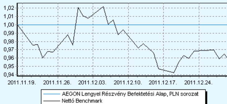
EGY JEGYRE JUTÓ NETTÓ ESZKÖZÉRTÉK, 2011.01.01 - 2011.12.31

Az alapok múltbeli teljesítménye nem nyújt garanciát a jövőbeli hozamok nagyságára. Jelen hirdetés nem minősül ajánlattételnek vagy befektetési tanácsadásnak. A befektetés részletes feltételeit az Alap Tájékoztatója tartalmazza, mely a mindenkor érvényes kondíciók listákkal együtt megtalálható a forgalmazási helyeken. A befektetési alap forgalmazásával (vétel, tartás, eladás) kapcsolatos költségek az alap kezelési szabályzatában és a forgalmazási helyeken megismerhetők.