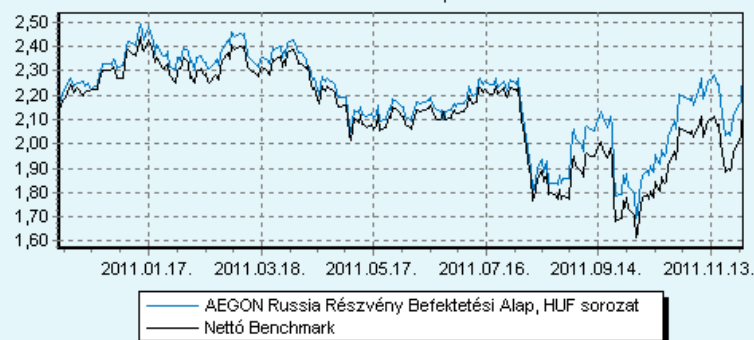
EGY JEGYRE JUTÓ NETTÓ ESZKÖZÉRTÉK, 2010.12.01 - 2011.11.30

Az alapok múltbeli teljesítménye nem nyújt garanciát a jövőbeli hozamok nagyságára. Jelen hirdetés nem minősül ajánlattételnek vagy befektetési tanácsadásnak. A befektetés részletes feltételeit az Alap Tájékoztatója tartalmazza, mely a mindenkor érvényes kondíciós listákkal együtt megtalálható a forgalmazási helyeken. A befektetési alap forgalmazásával (vétel, tartás, eladás) kapcsolatos költségek az alap kezelési szabályzatában és a forgalmazási helyeken megismerhetők.