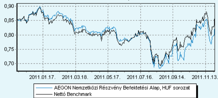
EGY JEGYRE JUTÓ NETTÓ ESZKÖZÉRTÉK, 2010.12.01 - 2011.11.30

Az alapok múltbeli teljesítménye nem nyújt garanciát a jövőbeli hozamok nagyságára. Jelen hirdetés nem minősül ajánlattételnek vagy befektetési tanácsadásnak. A befektetés részletes feltételeit az Alap Tájékoztatója tartalmazza, mely a mindenkor érvényes kondíciós listákkal együtt megtalálható a forgalmazási helyeken. A befektetési alap forgalmazásával (vétel, tartás, eladás) kapcsolatos költségek az alap kezelési szabályzatában és a forgalmazási helyeken megismerhetők.