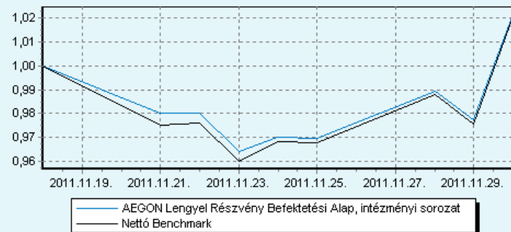
EGY JEGYRE JUTÓ NETTÓ ESZKÖZÉRTÉK, 2010.12.01 - 2011.11.30

Az alapok múltbeli teljesítménye nem nyújt garanciát a jövőbeli hozamok nagyságára. Jelen hirdetés nem minősül ajánlattételnek vagy befektetési tanácsadásnak. A befektetés részletes feltételeit az Alap Tájékoztatója tartalmazza, mely a mindenkor érvényes kondíciós listákkal együtt megtalálható a forgalmazási helyeken. A befektetési alap forgalmazásával (vétel, tartás, eladás) kapcsolatos költségek az alap kezelési szabályzatában és a forgalmazási helyeken megismerhetők.