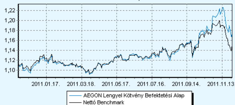
EGY JEGYRE JUTÓ NETTÓ ESZKÖZÉRTÉK, 2010.12.01 - 2011.11.30

Az alapok múltbeli teljesítménye nem nyújt garanciát a jövőbeli hozamok nagyságára. Jelen hirdetés nem minősül ajánlattételnek vagy befektetési tanácsadásnak. A befektetés részletes feltételeit az Alap Tájékoztatója tartalmazza, mely a mindenkor érvényes kondíciós listákkal együtt megtalálható a forgalmazási helyeken. A befektetési alap forgalmazásával (vétel, tartás, eladás) kapcsolatos költségek az alap kezelési szabályzatában és a forgalmazási helyeken megismerhetők.