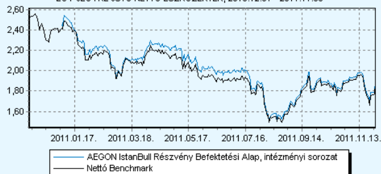
EGY JEGYRE JUTÓ NETTÓ ESZKÖZÉRTÉK, 2010.12.01 - 2011.11.30

Az alapok múltbeli teljesítménye nem nyújt garanciát a jövőbeli hozamok nagyságára. Jelen hirdetés nem minősül ajánlattételnek vagy befektetési tanácsadásnak. A befektetés részletes feltételeit az Alap Tájékoztatója tartalmazza, mely a mindenkor érvényes kondíciós listákkal együtt megtalálható a forgalmazási helyeken. A befektetési alap forgalmazásával (vétel, tartás, eladás) kapcsolatos költségek az alap kezelési szabályzatában és a forgalmazási helyeken megismerhetők.