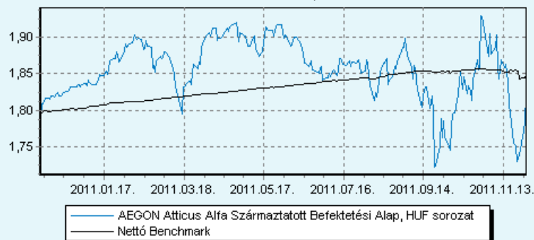
EGY JEGYRE JUTÓ NETTÓ ESZKÖZÉRTÉK, 2010.12.01 - 2011.11.30

Az alapok múltbeli teljesítménye nem nyújt garanciát a jövőbeli hozamok nagyságára. Jelen hirdetés nem minősül ajánlattételnek vagy befektetési tanácsadásnak. A befektetés részletes feltételeit az Alap Tájékoztatója tartalmazza, mely a mindenkor érvényes kondíciós listákkal együtt megtalálható a forgalmazási helyeken. A befektetési alap forgalmazásával (vétel, tartás, eladás) kapcsolatos költségek az alap kezelési szabályzatában és a forgalmazási helyeken megismerhetők.