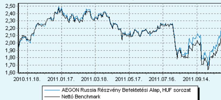
EGY JEGYRE JUTÓ NETTÓ ESZKÖZÉRTÉK, 2010.11.01 - 2011.10.31

Az alapok múltbeli teljesítménye nem nyújt garanciát a jövőbeli hozamok nagyságára. Jelen hirdetés nem minősül ajánlattételnek vagy befektetési tanácsadásnak. A befektetés részletes feltételeit az Alap Tájékoztatója tartalmazza, mely a mindenkor érvényes kondíciós listákkal együtt megtalálható a forgalmazási helyeken. A befektetési alap forgalmazásával (vétel, tartás, eladás) kapcsolatos költségek az alap kezelési szabályzatában és a forgalmazási helyeken megismerhetők.