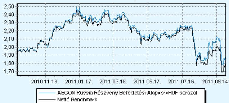
EGY JEGYRE JUTÓ NETTÓ ESZKÖZÉRTÉK, 2010.10.01 - 2011.09.30

Az alapok múltbeli teljesítménye nem nyújt garanciát a jövőbeli hozamok nagyságára. Jelen hirdetés nem minősül ajánlattételnek vagy befektetési tanácsadásnak. A befektetés részletes feltételeit az Alap Tájékoztatója tartalmazza, mely a mindenkor érvényes kondíciós listákkal együtt megtalálható a forgalmazási helyeken. A befektetési alap forgalmazásával (vétel, tartás, eladás) kapcsolatos költségek az alap kezelési szabályzatában és a forgalmazási helyeken megismerhetők.