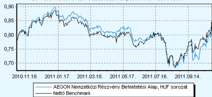
EGY JEGYRE JUTÓ NETTÓ ESZKÖZÉRTÉK, 2010.11.01 - 2011.10.31

Az alapok múltbeli teljesítménye nem nyújt garanciát a jövőbeli hozamok nagyságára. Jelen hirdetés nem minősül ajánlattételnek vagy befektetési tanácsadásnak. A befektetés részletes feltételeit az Alap Tájékoztatója tartalmazza, mely a mindenkor érvényes kondíciós listákkal együtt megtalálható a forgalmazási helyeken. A befektetési alap forgalmazásával (vétel, tartás, eladás) kapcsolatos költségek az alap kezelési szabályzatában és a forgalmazási helyeken megismerhetők.