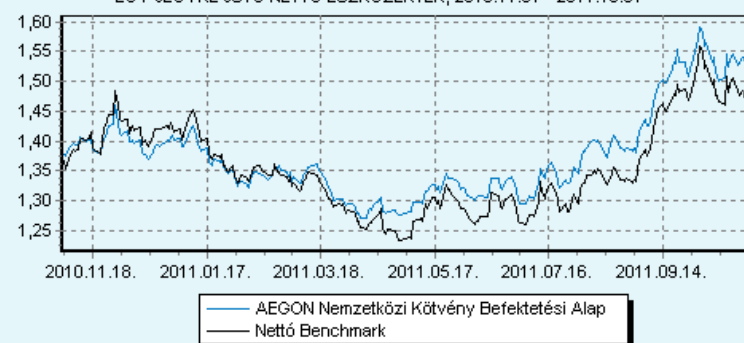
EGY JEGYRE JUTÓ NETTÓ ESZKÖZÉRTÉK, 2010.11.01 - 2011.10.31

Az alapok múltbeli teljesítménye nem nyújt garanciát a jövőbeli hozamok nagyságára. Jelen hirdetés nem minősül ajánlattételnek vagy befektetési tanácsadásnak. A befektetés részletes feltételeit az Alap Tájékoztatója tartalmazza, mely a mindenkor érvényes kondíciós listákkal együtt megtalálható a forgalmazási helyeken. A befektetési alap forgalmazásával (vétel, tartás, eladás) kapcsolatos költségek az alap kezelési szabályzatában és a forgalmazási helyeken megismerhetők.