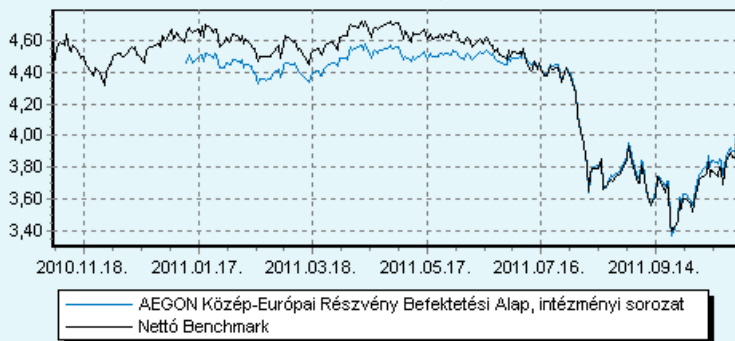
EGY JEGYRE JUTÓ NETTÓ ESZKÖZÉRTÉK, 2010.11.01 - 2011.10.31

Az alapok múltbeli teljesítménye nem nyújt garanciát a jövőbeli hozamok nagyságára. Jelen hirdetés nem minősül ajánlattételnek vagy befektetési tanácsadásnak. A befektetés részletes feltételeit az Alap Tájékoztatója tartalmazza, mely a mindenkor érvényes kondíciós listákkal együtt megtalálható a forgalmazási helyeken. A befektetési alap forgalmazásával (vétel, tartás, eladás) kapcsolatos költségek az alap kezelési szabályzatában és a forgalmazási helyeken megismerhetők.