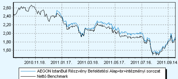
EGY JEGYRE JUTÓ NETTÓ ESZKÖZÉRTÉK, 2010.10.01 - 2011.09.30

Az alapok múltbeli teljesítménye nem nyújt garanciát a jövőbeli hozamok nagyságára. Jelen hirdetés nem minősül ajánlattételnek vagy befektetési tanácsadásnak. A befektetés részletes feltételeit az Alap Tájékoztatója tartalmazza, mely a mindenkor érvényes kondíciós listákkal együtt megtalálható a forgalmazási helyeken. A befektetési alap forgalmazásával (vétel, tartás, eladás) kapcsolatos költségek az alap kezelési szabályzatában és a forgalmazási helyeken megismerhetők.