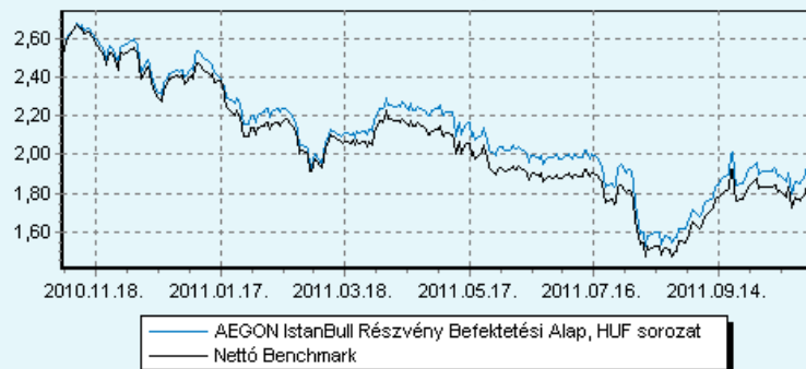
EGY JEGYRE JUTÓ NETTÓ ESZKÖZÉRTÉK, 2010.11.01 - 2011.10.31

Az alapok múltbéli teljesítménye nem nyújt garanciát a jövőbeli hozamok nagyságára. Jelen hirdetés nem minősül ajánlattételnek vagy befektetési tanácsadásnak. A befektetés részletes feltételeit az Alap Tájékoztatója tartalmazza, mely a mindenkor érvényes kondíciós listákkal együtt megtalálható a forgalmazási helyeken. A befektetési alap forgalmazásával (vétel, tartás, eladás) kapcsolatos költségek az alap kezelési szabályzatában és a forgalmazási helyeken megismerhetők.