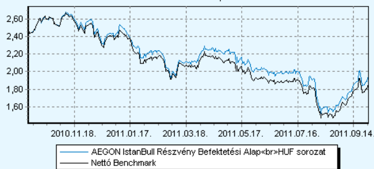
EGY JEGYRE JUTÓ NETTÓ ESZKÖZÉRTÉK, 2010.10.01 - 2011.09.30

Az alapok múltbeli teljesítménye nem nyújt garanciát a jövőbeli hozamok nagyságára. Jelen hirdetés nem minősül ajánlattételnek vagy befektetési tanácsadásnak. A befektetés részletes feltételeit az Alap Tájékoztatója tartalmazza, mely a mindenkor érvényes kondíciós listákkal együtt megtalálható a forgalmazási helyeken. A befektetési alap forgalmazásával (vétel, tartás, eladás) kapcsolatos költségek az alap kezelési szabályzatában és a forgalmazási helyeken megismerhetők.