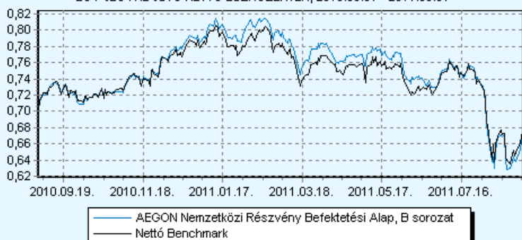
EGY JEGYRE JUTÓ NETTÓ ESZKÖZÉRTÉK, 2010.09.01 - 2011.08.31

Az alapok múltbeli teljesítménye nem nyújt garanciát a jövőbeli hozamok nagyságára. Jelen hirdetés nem minősül ajánlattételnek vagy befektetési tanácsadásnak. A befektetés részletes feltételeit az Alap Tájékoztatója tartalmazza, mely a mindenkor érvényes kondíciós listákkal együtt megtalálható a forgalmazási helyeken. A befektetési alap forgalmazásával (vétel, tartás, eladás) kapcsolatos költségek az alap kezelési szabályzatában és a forgalmazási helyeken megismerhetők.