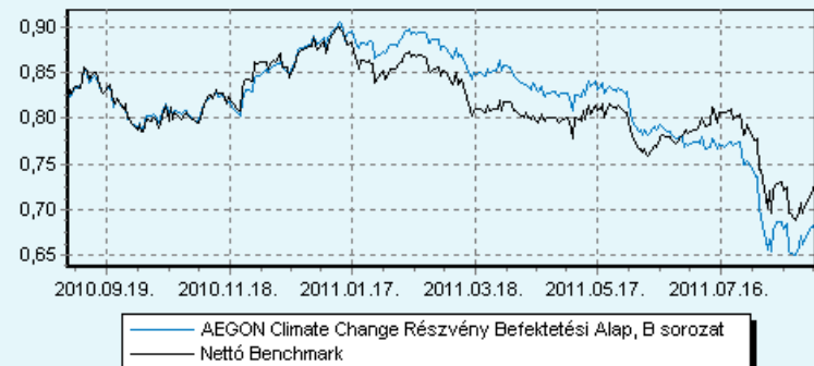
EGY JEGYRE JUTÓ NETTÓ ESZKÖZÉRTÉK, 2010.09.01 - 2011.08.31

Az alapok múltbeli teljesítménye nem nyújt garanciát a jövőbeli hozamok nagyságára. Jelen hirdetés nem minősül ajánlattételnek vagy befektetési tanácsadásnak. A befektetés részletes feltételeit az Alap Tájékoztatója tartalmazza, mely a mindenkor érvényes kondíciós listákkal együtt megtalálható a forgalmazási helyeken. A befektetési alap forgalmazásával (vétel, tartás, eladás) kapcsolatos költségek az alap kezelési szabályzatában és a forgalmazási helyeken megismerhetők.